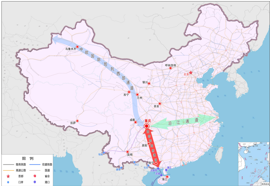
西部陆海新通道地理位置示意图（全国）